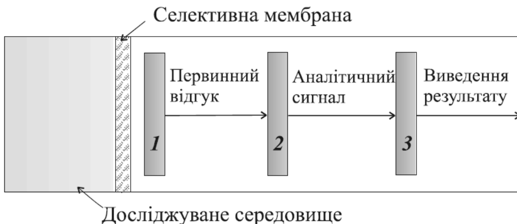
Рис. 3. Схема роботи електрохімічного сенсора:

1 – чутливий шар детектора, 2 – перетворювач сигналу, 3 – електронний блок