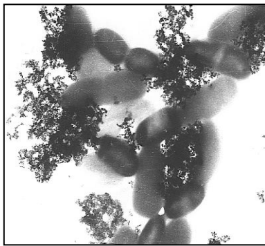
Рис. 10.2. Аглотинація синьо-гнійних паличок у суспензії ВДК (електронна мікрофотографія, збільшення 20000) [1]

Різні білки сорбуються Силіксом у кількості від 200 до 700 мг/г, причому непориста структура забезпечує високу швидкість адсорбції: основна маса білка, не менше 90 %, видаляється з розчину вже за 10 хвилин. Очевидно, білоксорбційними властивостями Силіксу пояснюється його здатність зв'язувати значні кількості мікроорганізмів – понад 10 млрд мікробних тіл/г, незалежно від видової приналежності (для порівняння: вуглецевий ентеросорбент СКН при адсорбції білка 7–10 мг/г зв'язує мікробних тіл до 0,1 млрд/г).